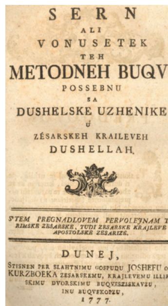
Metodne bukve za duželske učence, 1777

Leta 1777 je v nemščini izšla Felbigerjeva knjiga Methodenbuch für Lehrer der deutschen Schulen in den kaiserlich-königlichen Erblanden, ki je bila prevedena tudi v slovenščino z naslovom Sern ali vonusetek teh metodnih buqvi posebnu sa dushelske uzhenike u zesarskeh kraileveh dushellah, Dunej, 1777. Prečrkovano v današnjo pisavo zaradi lažje berljivosti se glasi Sern ali vonusetek teh metodnih bukev posebnu za duželske učence u cesarskeh kraileveh duželah, Dunej, 1777. Gre za skrajšan in prirejen priročnik za osnovnošolske učitelje v katerem so navodila za delo učiteljev.